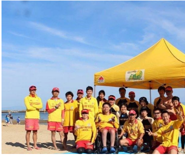
須磨ビーチフェスタ