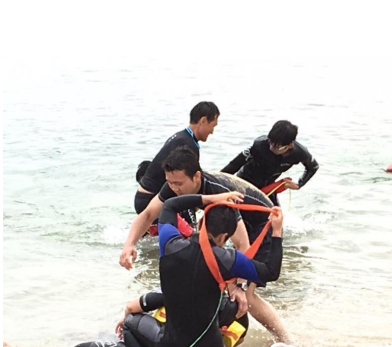
ライフセーバー講習会