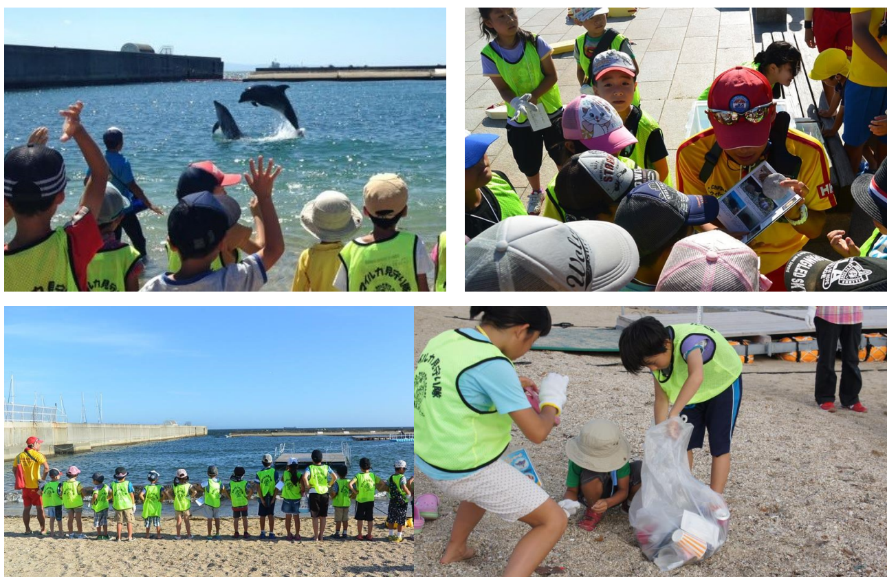
スマイルカ見守り隊 ビーチクリーン活動